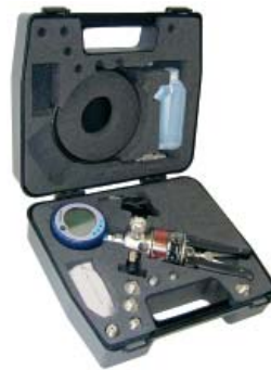
Trusă de testare hidraulică