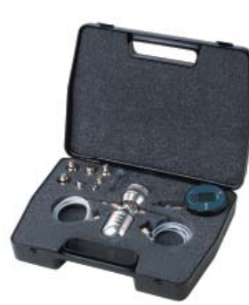
Trusă de testare pentru presiuni joase