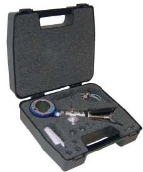
Trusă de testare pneumatică