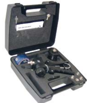
Trusă de testare pneumatică și hidraulică